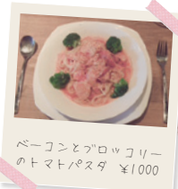
ベーコンとフロッコリーのトマトパスタ ¥1000