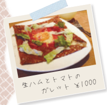
生ハムとトマトのガレット ¥1000

1人につき、ワンドリンク制となっていて、食事は、軽食からしっかりとした食事まであります。カクテルやワインなどのお酒も飲むことができます！