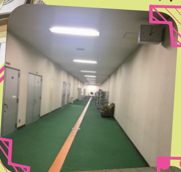
▼ 道路みたいな廊下