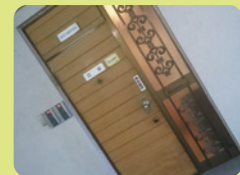
▲ 家の玄関? 倉庫の扉です